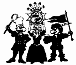
Die vier Kämpfer für den Spaß

Buchungsname: Janssen Ort: Kempen Termin: 13.6. 18.6.