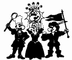
Die vier Kämpfer für den Spaß

Bitte sagen Sie uns anhand dieses Fragebogens, wie es Ihnen bei uns gefallen hat. Mit diesem Fragebogen möchten wir eventuelle von uns nicht erkannte Mängel aufdecken, damit wir zukünftig noch bessere Leistungen für Sie erbringen können. Ihre Meinung ist uns wichtig!!!