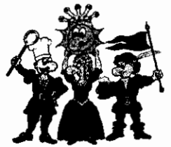
Die vier Kämpfer für den Spaß