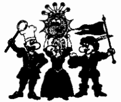
Die vier Kämpfer für den Spaß

Buchungsname: S. ... Ort: Hattingen Termin: 06.-09.17