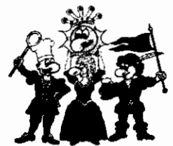
Die vier Kämpfer für den Spaß

Buchungsname: Hempert Ort: Zoohof Termin: 13.06.11 Clubhotel Ferienpark Hochsauerland