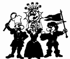
Die vier Kämpfer für den Spaß

Buchungsname: Ruffner, Werner & Familie Termin: 27. - 30. 6