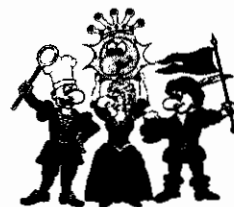
Die vier Kämpfer für den Spaß

Buchungsname: Schmidl Ort: Flein Termin: 6.6.11 - 9.6.11