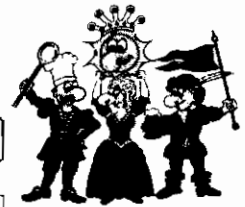
Die vier Kämpfer für den Spaß

Bitte sagen Sie uns anhand dieses Fragebogens, wie es Ihnen bei uns gefallen hat. Mit diesem Fragebogen möchten wir eventuelle von uns nicht erkannte Mängel aufdecken, damit wir zukünftig noch bessere Leistungen für Sie erbringen können.