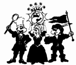
Die vier Kämpfer für den Spaß

Buchungsname: Heisler Ort: 46982 Dorsten Termin: 6.-9.6.11