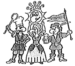
Die vier Kämpfer für den Spaß

Bitte sagen Sie uns anhand dieses Fragebogens, wie es Ihnen bei uns gefallen hat. Mit diesem Fragebogen möchten wir eventuelle von uns nicht erkannte Mängel aufdecken, damit wir zukünftig noch bessere Leistungen für Sie erbringen können. Ihre Meinung ist uns wichtig!!!