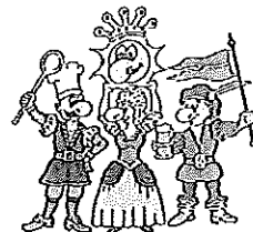
Die vier Kämpfer für den Spaß

Bitte sagen Sie uns anhand dieses Fragebogens, wie es Ihnen bei uns gefallen hat. Mit diesem Fragebogen möchten wir eventuelle von uns nicht erkannte Mängel aufdecken, damit wir zukünftig noch bessere Leistungen für Sie erbringen können. Ihre Meinung ist uns wichtig!!!