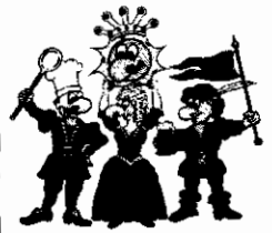
Die vier Kämpfer für den Spaß

Bitte sagen Sie uns anhand dieses Fragebogens, wie es Ihnen bei uns gefallen hat. Mit diesem Fragebogen möchten wir eventuelle von uns nicht erkannte Mängel aufdecken, damit wir zukünftig noch bessere Leistungen für Sie erbringen können.