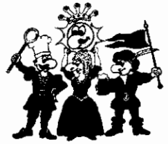
Die drei Kämpfer für den Spaß

Bitte sagen Sie uns anhand dieses Fragebogens, wie es Ihnen bei uns gefallen hat. Mit diesem Fragebogen möchten wir eventuelle von uns nicht erkannte Mängel aufdecken, damit wir zukünftig noch bessere Leistungen für Sie erbringen können. Ihre Meinung ist uns wichtig!!!