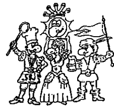
Die vier Kämpfer für den Spaß

Bitte sagen Sie uns anhand dieses Fragebogens, wie es Ihnen bei uns gefallen hat. Mit diesem Fragebogen möchten wir eventuelle von uns nicht erkannte Mängel aufdecken, damit wir zukünftig noch bessere Leistungen für Sie erbringen können. Ihre Meinung ist uns wichtig!!!