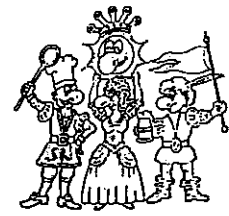
Die vier Kämpfer für den Spaß

Bitte sagen Sie uns anhand dieses Fragebogens, wie es Ihnen bei uns gefallen hat. Mit diesem Fragebogen möchten wir eventuelle von uns nicht erkannte Mängel aufdecken, damit wir zukünftig noch bessere Leistungen für Sie erbringen können. Ihre Meinung ist uns wichtig!!!