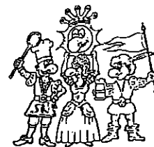
Die vier Kämpfer für den Spaß

Bitte sagen Sie uns anhand dieses Fragebogens, wie es Ihnen bei uns gefallen hat. Mit diesem Fragebogen möchten wir eventuelle von uns nicht erkannte Mängel aufdecken, damit wir zukünftig noch bessere Leistungen für Sie erbringen können. Ihre Meinung ist uns wichtig!!!