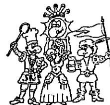
Die vier Kämpfer für den Spaß

Bitte sagen Sie uns anhand dieses Fragebogens, wie es Ihnen bei uns gefallen hat. Mit diesem Fragebogen möchten wir eventuelle von uns nicht erkannte Mängel aufdecken, damit wir zukünftig noch bessere Leistungen für Sie erbringen können. Ihre Meinung ist uns wichtig!!!