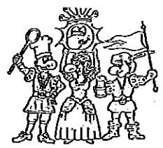
Die vier Kämpfer für den Spaß

Bitte sagen Sie uns anhand dieses Fragebogens, wie es Ihnen bei uns gefallen hat. Mit diesem Fragebogen möchten wir eventuelle von uns nicht erkannte Mängel aufdecken, damit wir zukünftig noch bessere Leistungen für Sie erbringen können. Ihre Meinung ist uns wichtig!!!