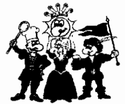
Die vier Kämpfer für den Spaß

Bitte sagen Sie uns anhand dieses Fragebogens, wie es Ihnen bei uns gefallen hat. Mit diesem Fragebogen möchten wir eventuelle von uns nicht erkannte Mängel aufdecken, damit wir zukünftig noch bessere Leistungen für Sie erbringen können. Ihre Meinung ist uns wichtig!!!