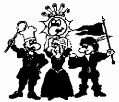
Die vier Kämpfer für den Spaß

Buchungsname: Sandströper Ort: 48653 Boesfeld Termin: 05.09.-08.09